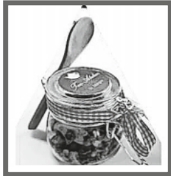
Wintertee im Glas 7,90 €