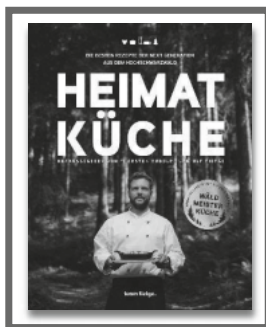
NEU Kochbuch „Heimatküche“ 29,80 €

Erhältlich in der Tourist-Information Schluchsee Montag bis Freitag: 9 - 16 Uhr