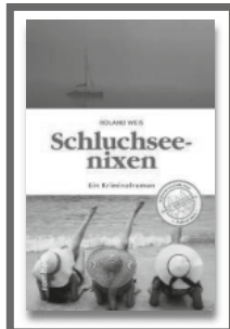
Krimi „Schluchseexen“ 14,00 €