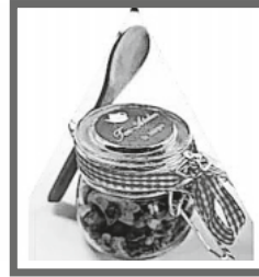
Wintertee im Glas 7,90 €