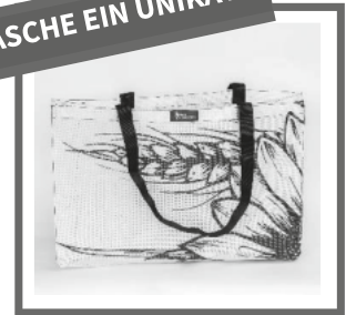
Bannertasche Caritas 14,95 €