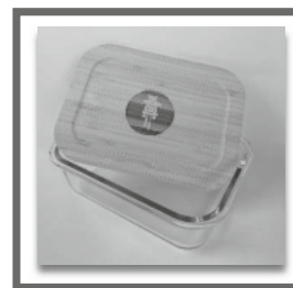
Vorratsdose mit Deckel 14,95 €

Erhältlich in der Tourist-Information Schluchsee