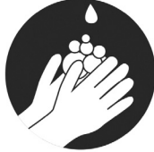
Hygiene Hände waschen / desinfizieren