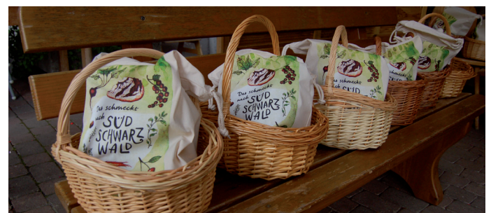
Die Naturpark-Vespertouren verbinden regionalen Genuss und Naturerlebnis.

Dieses Projekt wurde gefördert mit Mitteln des Landes Baden-Württemberg und der Lotterie Glücksspirale.