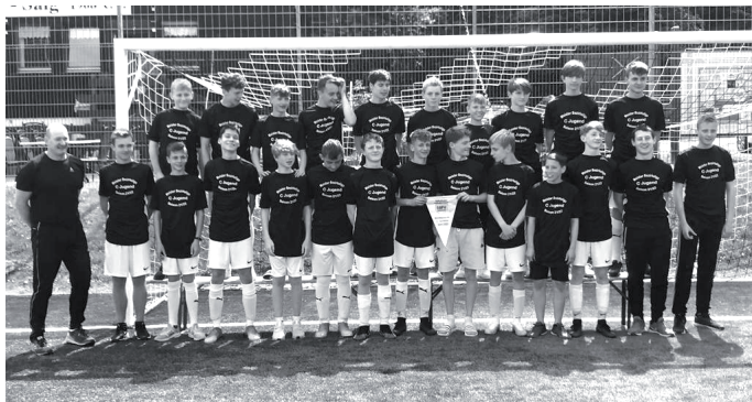
Die C-Junioren Meister in der Bezirksliga Schwarzwald Saison 21/22

16:00 SG Oberes Bregtal: SG Schluchsee 1