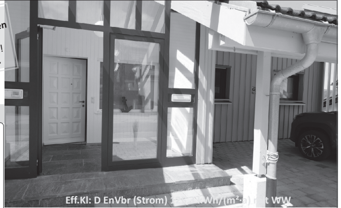
Eff.Kl: D EnVbr (Strom) 2,0 kWh/(m²·a) mit WW