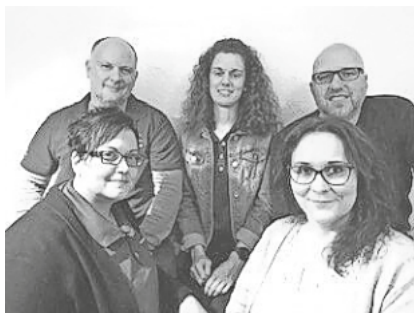
Herzliche Glückwünsche zur Wahl