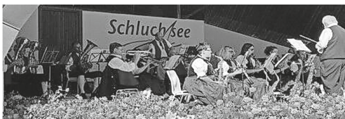
_ Foto: Musikverein Schluchsee