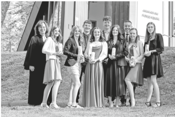
Konfirmation in Schluchsee: wir sagen Danke!

Gemeindeversammlung am 18.6.23- Zukunft unserer Gemeinden: Reduktionen und Veränderungen. Einladung für