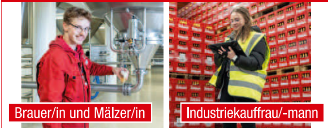
Brauer/in und Mälzer/in