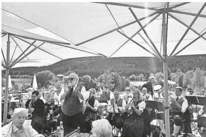
gez. Marianne Kohls