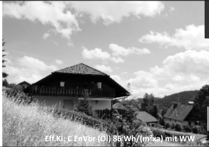
Eff.Kl.: C EnVbr (Öl) 86 Wh/(m²xa) mit WW

Immobilien- & Sachverständigen-Büro Kirchgasse 3 D-79868 Feldberg Telefon: 07655-1521 www.dahoim-immobilien.de