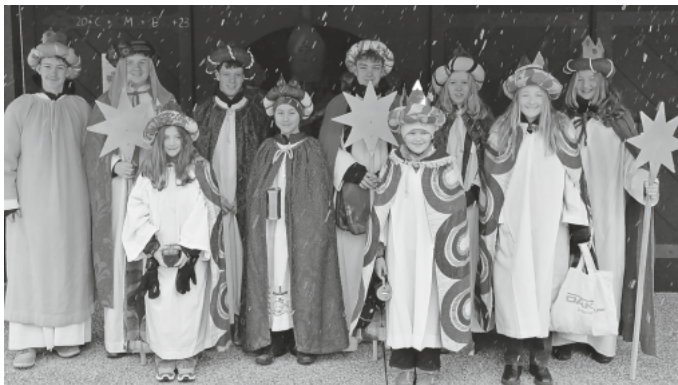
Sternsinger Schluchsee

Zum Jahresbeginn waren in unserer Gemeinde wieder die Sternsinger unterwegs. Sie brachten den Menschen die frohe Botschaft von Weihnachten und schrieben den Segen Gottes an die Haustüren. Gleichzeitig sammelten sie in Zusammenarbeit mit dem Sternsingerwerk für die Organisation NETZ-Bangladesch. Das gesammelte Geld kommt Kindern aus den ärmsten Familien in Bangladesch zu Gute, um ihnen den Schulbesuch zu ermöglichen und so aus der Kinderarbeit und dem Kreislauf der Armut heraus zu kommen.