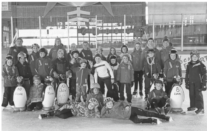
Die Gruppe in der Eishalle