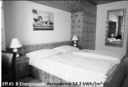
Eff.Kl: B Energieverb. Fernwärme 54,2 kWh/(m²·a)