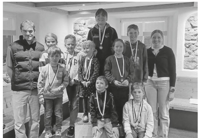
Die Klassensieger