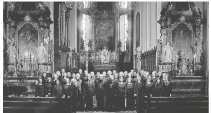
Alemannische Passion am 29. März 19 Uhr in der Feldbergkirche

„Alemannische Passion“: Palmsonntag, 29. März, um 19:00 Uhr in der Feldbergkirche.