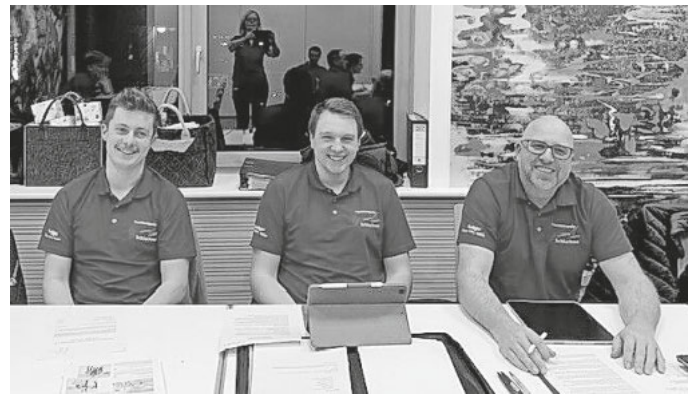
neugewählter Vorstand der Bläserjugend

- 25.04.26 / 9:45 h treffen am Pfarrzentrum Erstkommunion in Schluchsee