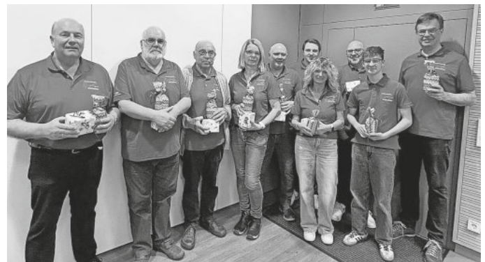
Ehrung der besten Probenbesucher und Auftritte