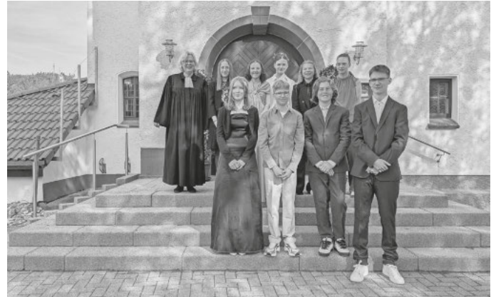
Konfirmation: Wir sagen herzlich Danke!!!